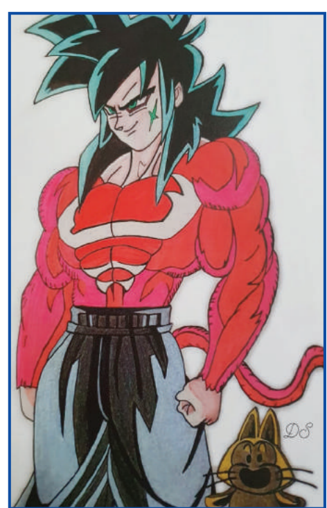
Même pas peur...